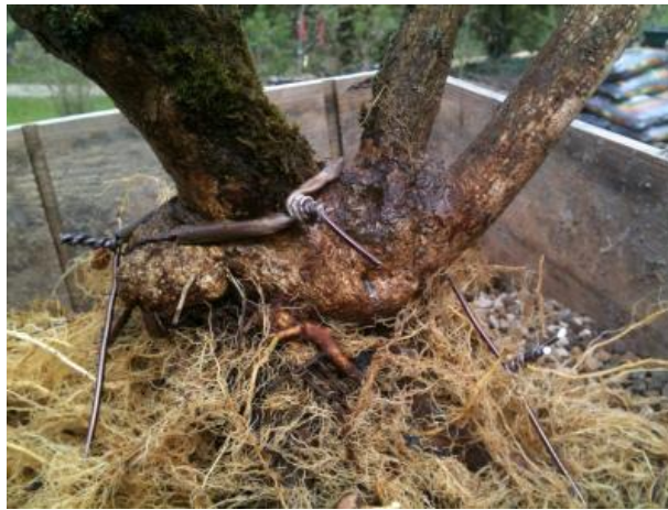
( http://www.parlonsbonsai.com/forums/uploads/post-801-0-58378300-1385628773.jpeg )