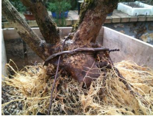
( http://www.parlonsbonsai.com/forums/uploads/post-801-0-72666900-1385628772.jpeg )